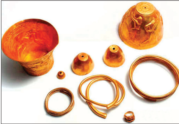
Рис. 5. Вещи из Сенгелеевского клада