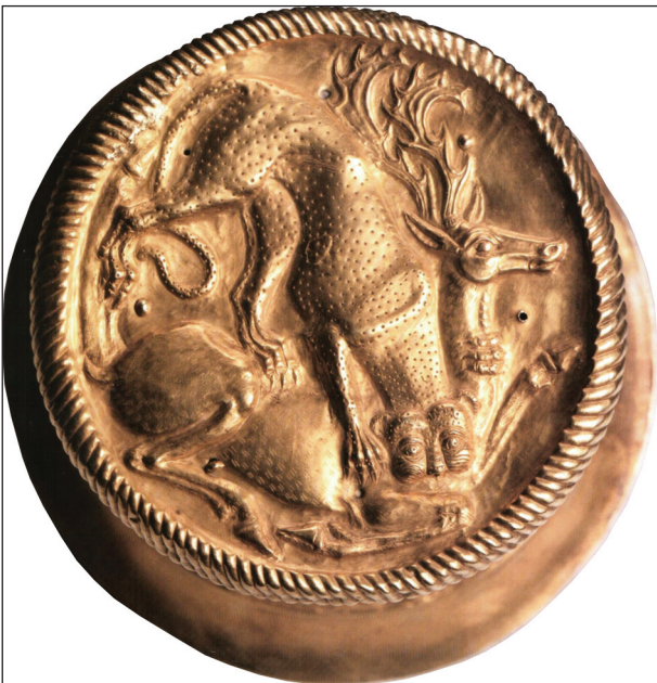
Рис. 2. Конус из Братолюбовского кургана. Вид сверху

было связано с появлением здесь сарматов ранней волны.