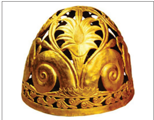
Рис. 4. Конус из Ак-Бурунского кургана

женном на периферии кургана, исследованного у с. Сенгелеевское неподалеку от Ставрополя. Кстати, это село находится на территории того же Шпаковского района, что и с. Казинка, где был найден Казинский клад.