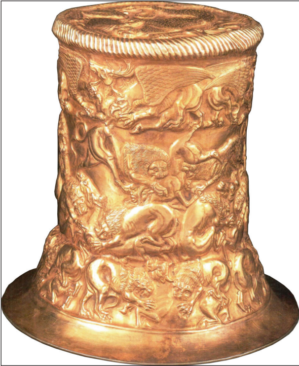
Рис. 1. Конус из Братолюбовского кургана