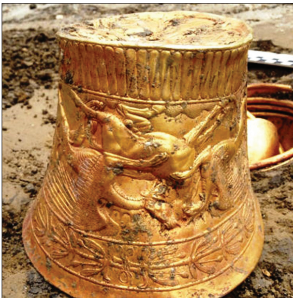
Рис. 6. Конус 1 из Сенгелеевского клада