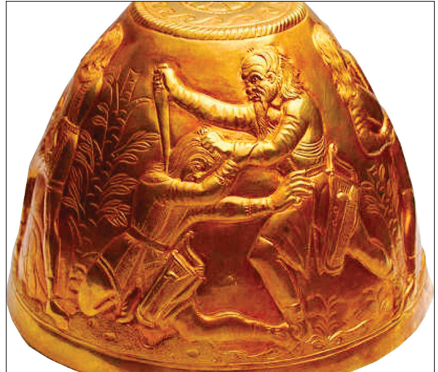
Рис. 8. Конус 2 из Сенгелеевского клада

швы, обувь, типы луков и колчанов. В нижней части «картинь» размещены еще две фигуры бойцов. Один лежит, а у второго, по всей видимости, отсечена голова (рядом с ним лежит,