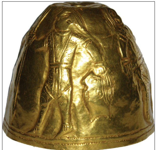
Рис. 9. Конус из Курджипского кургана

вероятно, скальпированный череп). Ярко выражен и образ одного из участников сцены — лицо пожилого человека испещрено морщинами, а голова «украшена» тонко проработанной прической.