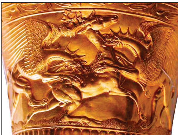
Рис. 7. Деталь декора конуса 1 из Сенгелеевского клада

швы, обувь, типы луков и колчанов. В нижней части «картинь» размещены еще две фигуры бойцов. Один лежит, а у второго, по всей видимости, отсечена голова (рядом с ним лежит,