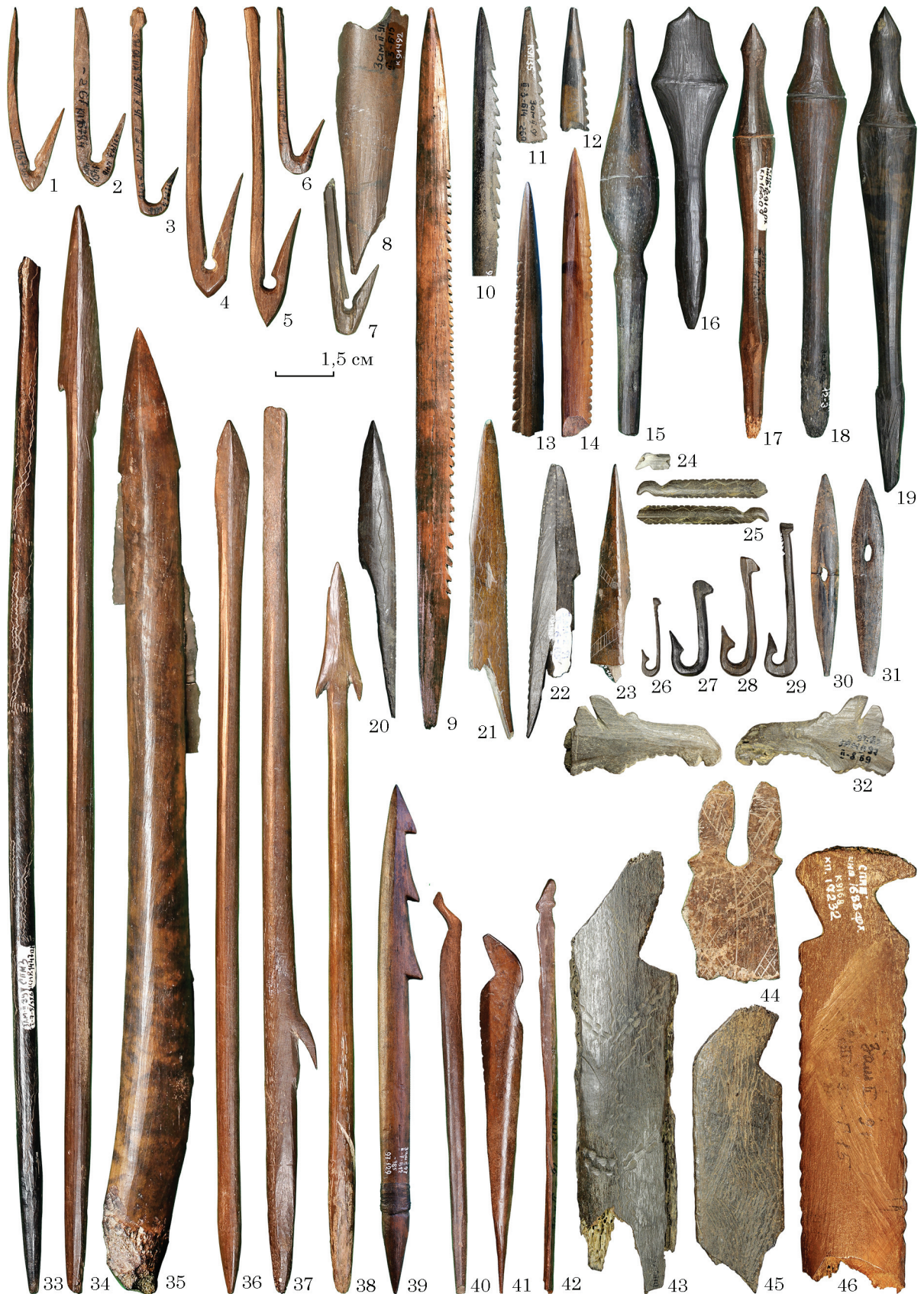
Рис. 3. Замостя 2, вироби з кістки і рогу лося: 1—7, 26—31 — рибальські гачки; 8 — кістка зі слідами від вирізання гачка; 9—14, 39 — зубчасті вістря; 15—19, 33, 34, 36—38 — наконечники стріл; 20—23 — пазові наконечники; 24, 25, 40—42 — шпильки з зооморфним наверхшям; 32 — головка лося; 35 — наконечник дротика із вкладишами; 43—46 — ножі з ребер лося з фігурним наверхшям (1—19 — ранній неоліт, 20—46 — пізній мезоліт)