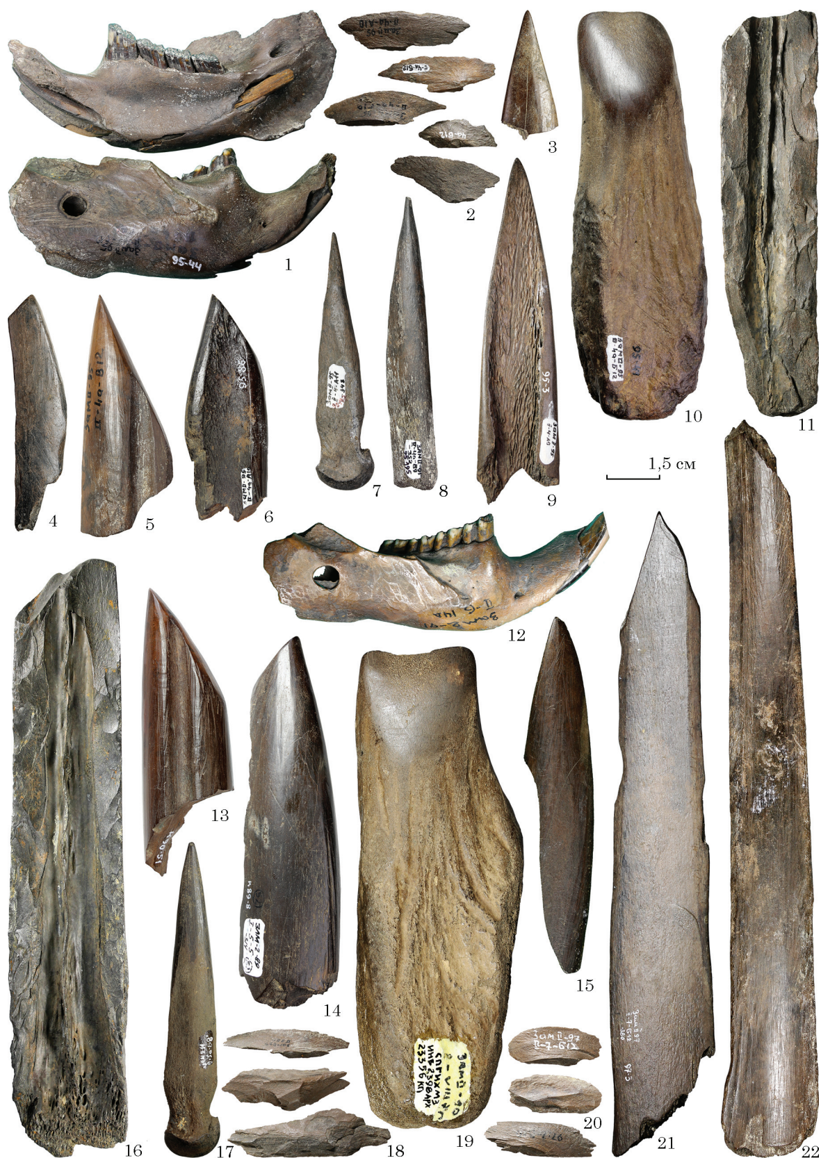
Рис. 2. Замостя 2, вироби з кістки і рогу лося: 1, 12 — знаряддя зі щелепи бобра; 2, 18, 20 — кістяні відщепи від оббивання трубчастих кісток; 3, 9, 15, 21, 22 — ножі з ребер лося; 4—6, 13, 14 — знаряддя, скошені під кутом 45°; 7, 8, 17 — проколки з грифельних кісток; 10, 19 — сокири / тесла з рогу лося; 11, 16 — заготовки із оббитих трубчастих кісток (1—11 — ранній неоліт, 12—22 — пізній мезоліт)