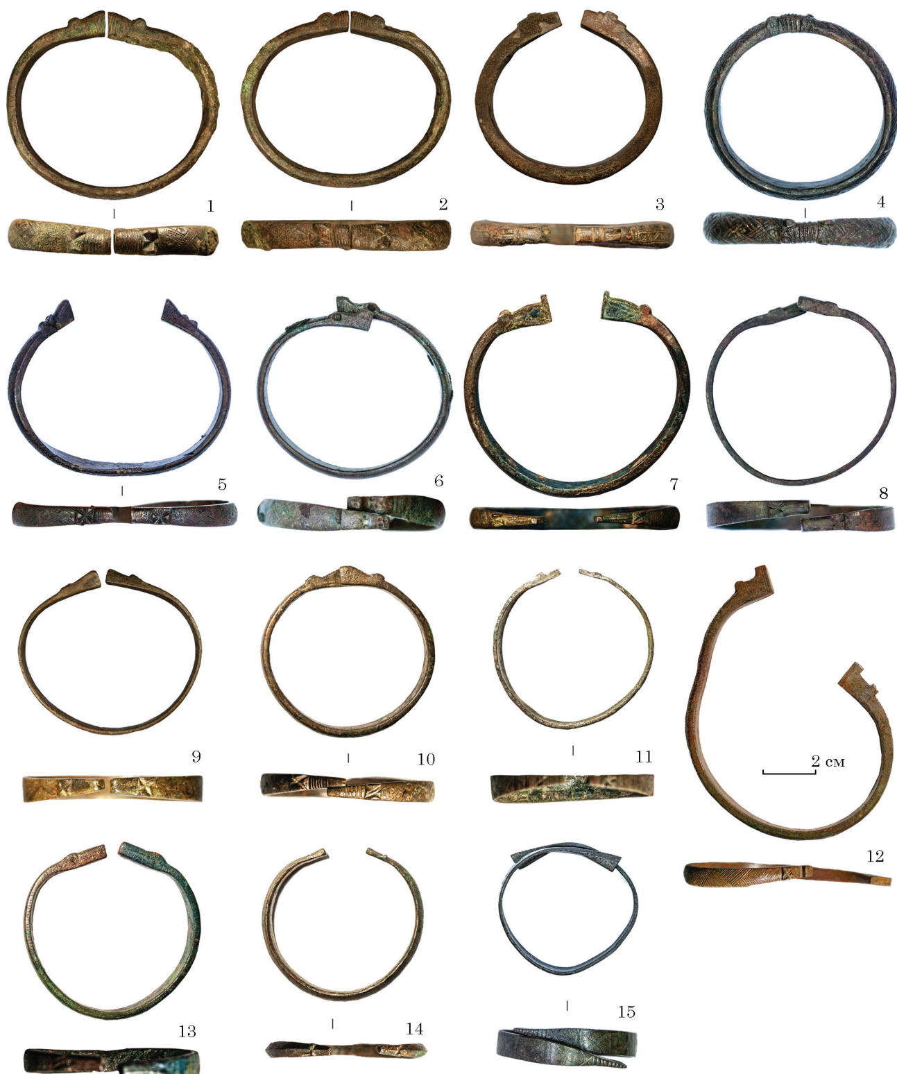
Рис. 1. Колекція браслетів з зооморфними закінченнями могильника Острів: 1—2, 9 — жіноче поховання 2; 3 — чоловіче поховання 23; 4, 6 — жіноче поховання 72; 5, 8, 12 — випадкові знахідки; 7 — жіноче поховання 1; 10 — чоловіче поховання 41; 11, 14 — жіноче поховання 46; 13 — жіноче поховання 53; 15 — культурний шар

менше — серед прусів, скальвів і земгалів) та навіть у скандинавів, передусім — на о-ві Готланд (Thunmark-Nylén 1998, Taf. 160: 1—5).