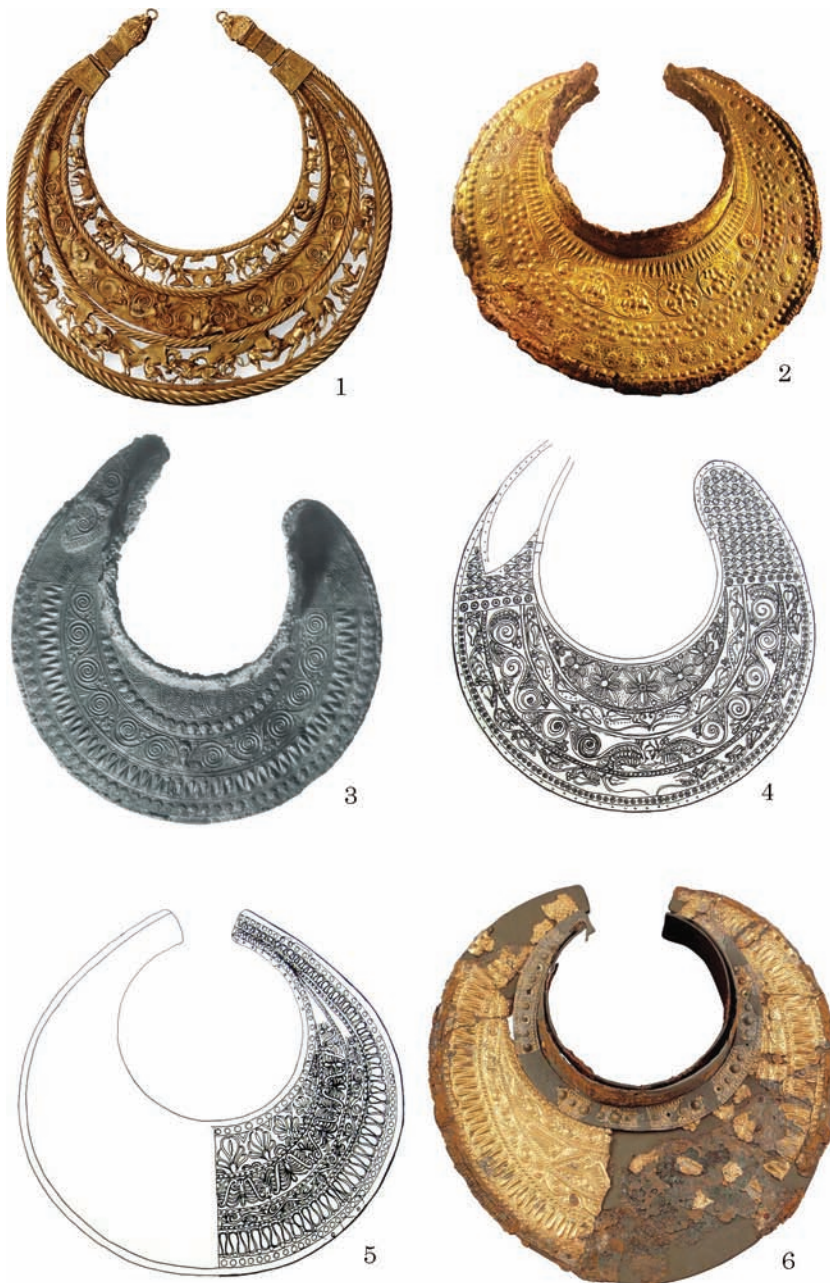
Рис. 5. Пектораль з Товстої Могили та нагрудники з Фракії та Македонії: 1 — Товста Могила; 2 — Вергіна; 3 — Мезек; 4 — Вирбиця; 5 — Катеріні; 6 — Підна (за: 1 — Dally 2008; 2 — Andronicos 1984; 3 — Венедиков, Герасимов 1973; 4 — Archibald 1985; 5 — Archibald 1985; 6 — Grammenos 2004)

була А. П. Манцевич, яка обґрунтувала свою позицію в низці статей (Манцевич 1976, 1980). Дослідниця була впевнена в північно-балканському походженні пекторалі, підтвердження якому знаходила в безлічі «фракійських» рис — від ідентичності форми з пектораліями з Мезека та Вирбиці до констатації портретної схожості персонажів центральної сцени з правителем Одриського царства Севтом III (Манцевич 1980, с. 119). Багато положень, висунутих А. П. Манцевич, були піддані критиці Б. М. Мозолевським. Дослідник заперечував фракійське походження пекторалі (на користь північнопричорноморському), а також