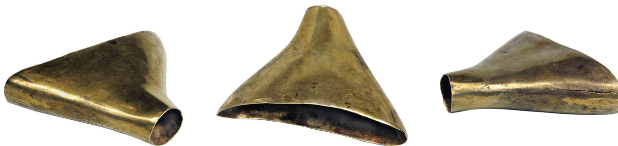
Рис. 2. Золотий предмет (вотолка) кінського спорядження з колекції В. Н. і Б. І. Ханенків

1906, с. 158, рис. 17) двох різних розмірів — 63 і 58 мм. Зважаючи на всі обставини, можна стверджувати, що бляхи з ханенківської колекції також походять з кургану Огуз.