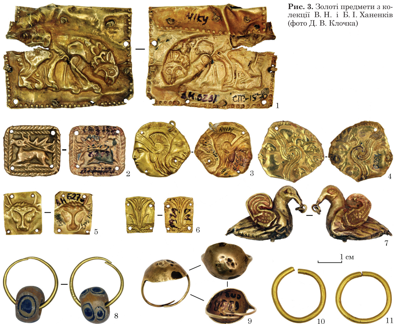
Рис. 3. Золоті предмети з колекції В. Н. і Б. І. Ханенків

До спорядження коней відносяться й предмети, що склали комплекс нагрудних прикрас. Вони виготовлені із золота, срібла і бронзи та, вірогідно, належали до кількох комплектів — можливо, 1 або 2 золотих та 1 срібного (Спицын 1906, с. 159, рис. 19, 21, 23; Манцевич 1980, с. 282, рис. 10; 11). Оскільки відсутні будь-які дані про поховальний кортеж, то можна припустити, що золоті конуси також були належністю верхових коней і могли бути задіяні як попарно, так і по одному, що більш імовірно. В такому разі практично всі коні, поховані у дромосі Центральної споруди кургану Огуз, мали ті чи інші нагрудні прикраси: нагрудник з підвісками або вотолку.