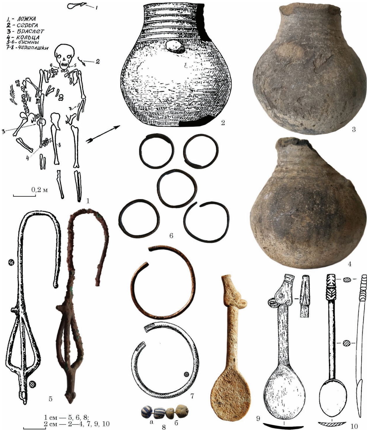
Рис. 4. Грушівка, к. 5, п. 1: 1 — план; 2—4 — горщик; 5 — підвіска; 6 — обручки; 7 — браслет; 8 — намисто; 9 — ложечка; 10 — ложечка, Перегрузне 1, к. 45 (за: 1 — Березовец 1952; 2, 5, 7, 9 — Смирнов 1984; 10 — Балабанова та ін. 2014; фото автора)

описаний ним поховальний обряд є незвичний для сарматів, перш за все, відсутністю могильної ями. Вивчення польової документації (щоденника і креслень) не прояснило питання. Згідно тексту Д. Т. Березовця, скелети лежали на материку, але рівень залягання материка не позначений. При висоті насипу у 0,5 м (від сучасної поверхні?) та звичайній потужності орного шару в цих краях біля 0,3—0,4 м рівень