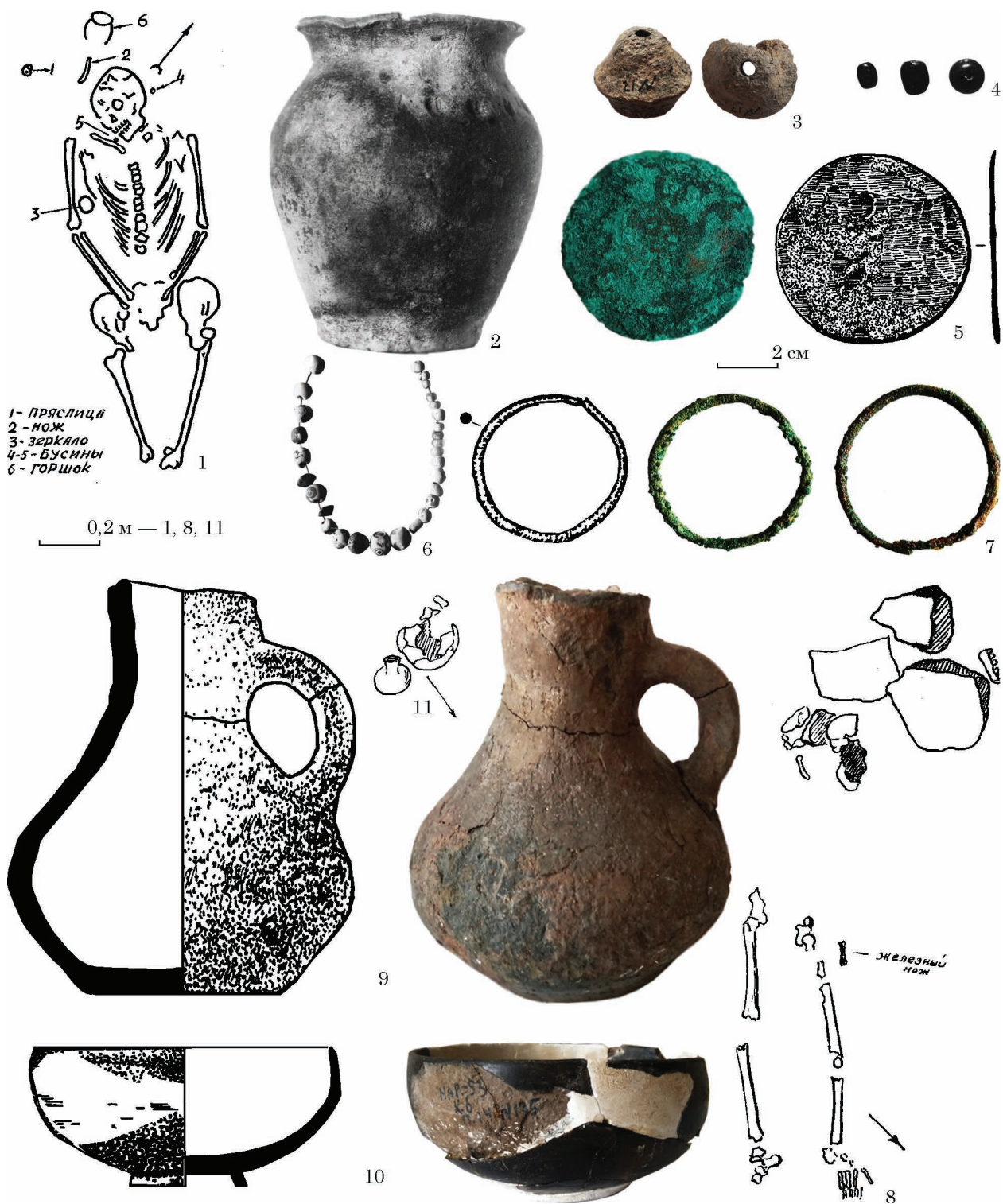
Рис. 6. Сарматські поховання біля с. Мар'янське: 1—7 — курган 3, пох. 6; 8 — курган 5, пох. 6; 9—11 — курган 6, пох. 14 (фото автора; 1—3, 5, 6, 9 — за Фурманская и др. 1953)

руди не простежувалися. На глибині 0,65 м — череп скелета, орієнтований на північ — північний схід (рис. 6: 9). Поруч знайдено посудини (1, 2).