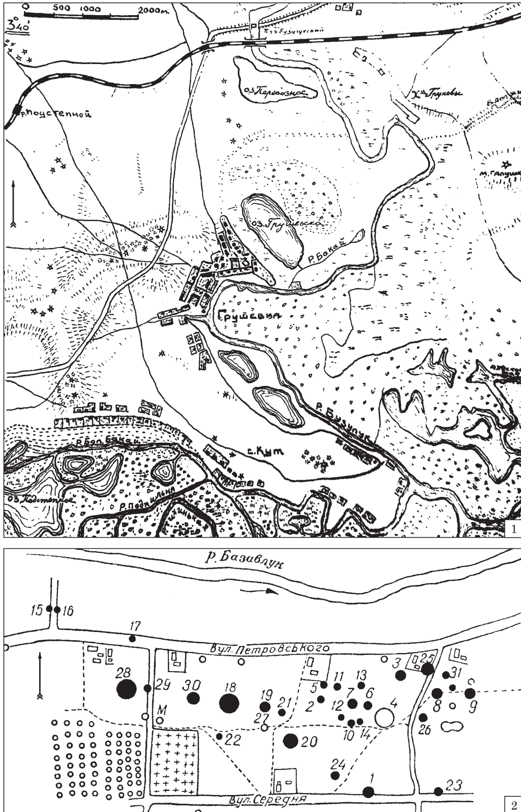
Рис. 1. Зона досліджень експедицій Д. Т. Березовця у 1951 і 1953 рр.: 1 — загальний план робіт Горностаївської експедиції; 2 — план курганної групи у с. Кут (за Березовець 1951)

жується до кільцевого конічного піддону. По основі вінець — подвійна врізна лінія. На плічку дві (збереглася одна) сплюснуті на згині ручки з