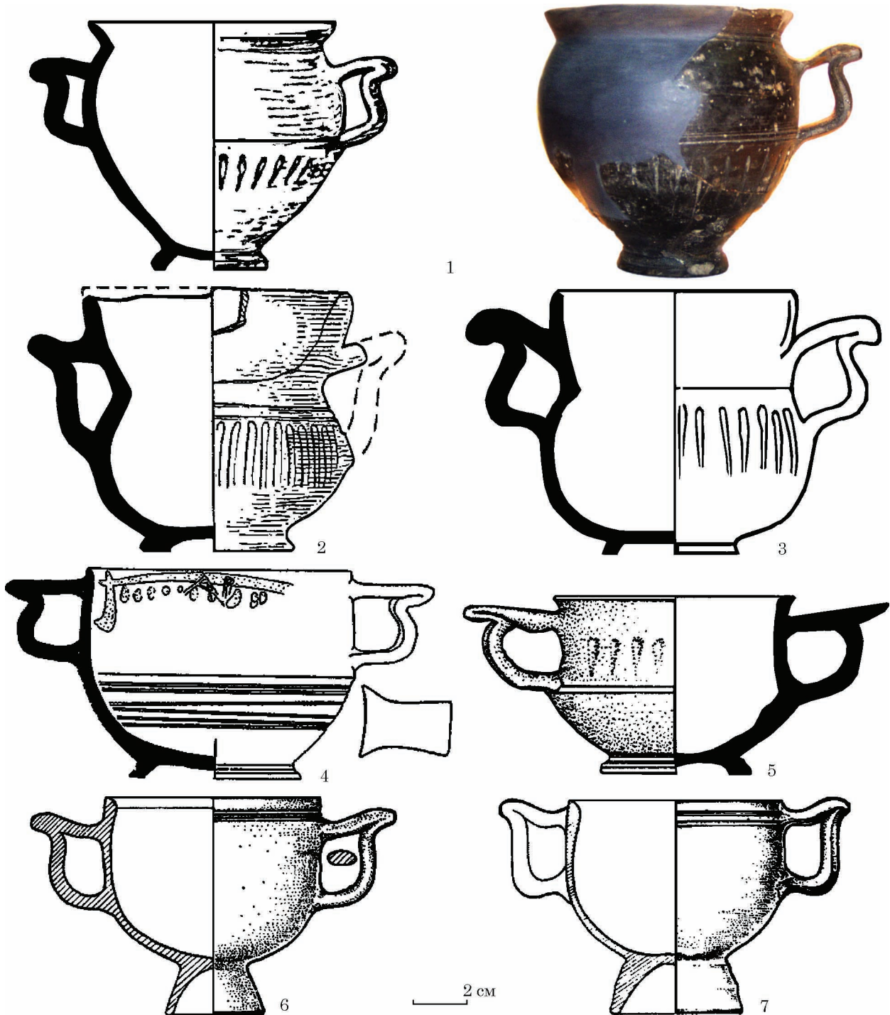
Рис. 3. Канфари пізньоелліністичного типу: 1 — Кут, к. 1, насип; 2 — Золота Балка, пох. 43; 3 — могильник Криволіманський 1; 4 — могильник Біляус, пох. 39; 5 — могильник біля хут. Леніна, пох. 3; 6, 7 — резиденція Хрисаліска (за: 1 — фото автора; 2 — Вязьмитина 1972; 3 — Глухов 2005; 4 — Дашевская 2014; 5 — Лимберис, Марченко 2005; 6, 7 — Сокольский 1976)

виготовлення обидва глеки є типовими зразками пізньоелліністичної кераміки. Цікаво, що у деяких ранньосарматських похованнях півдня України (Львове, к. 6, п. 1; Заможне, к. 13, п. 1) виявлені ліпні сарматські репліки античних глеків з наліпним ребром по горлу (Симоненко 1977, с. 226—227, рис. 4: 2; 1991, с. 26, рис. 3: 3). Чорний матовий лак дозволяє віднести кутянський глек до пізньоелліністичного часу.