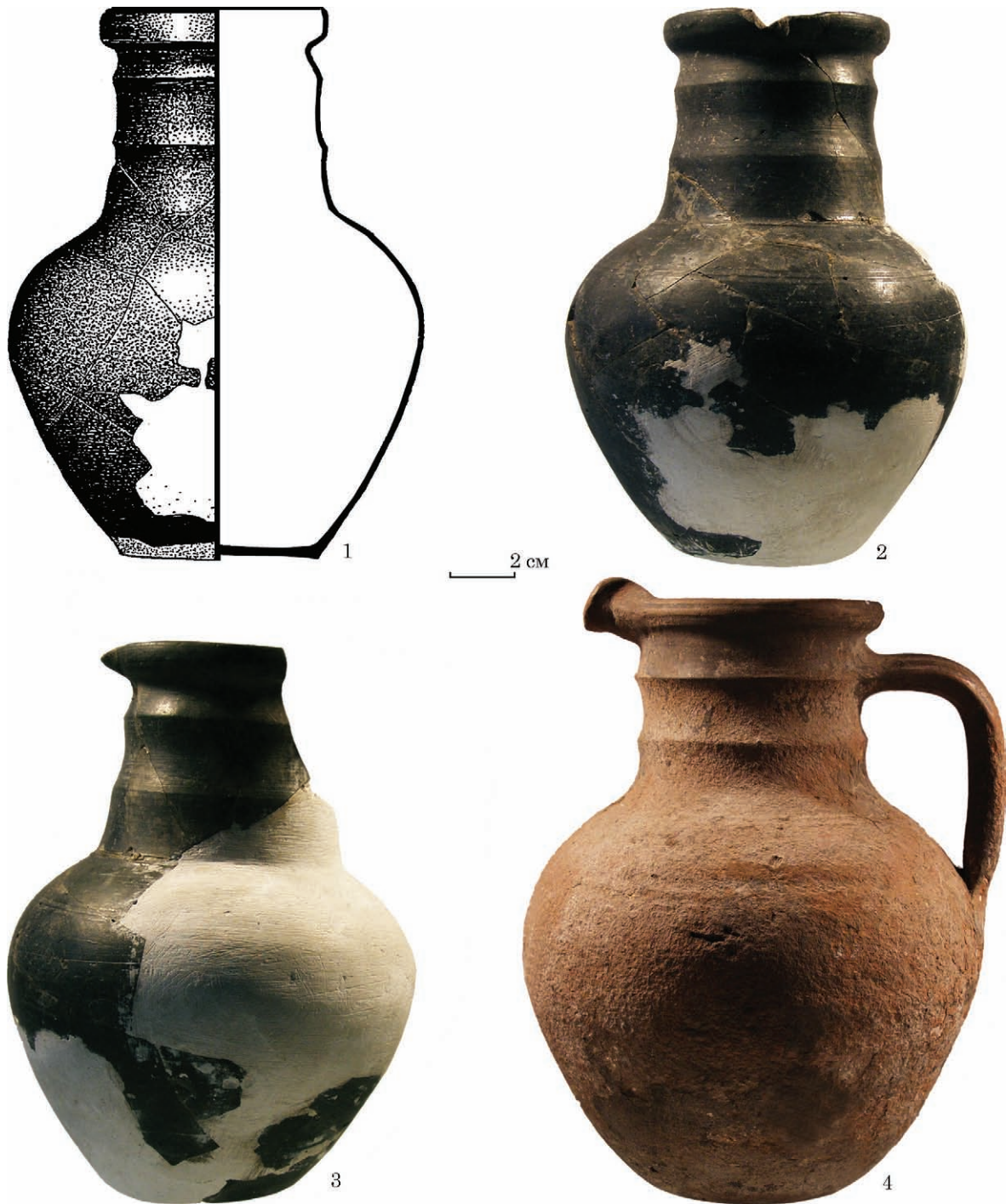
Рис. 2. Керамічний посуд: 1—3 — Кут, к. 1, насип; 4 — Новогригорівка, к. 1, п. 22

ки, що імітують канелюри (рис. 3: 1). Поверхня вкрита чорним матовим лаком. Діаметр вінець 9,2 см, піддону 4,2 см, висота посудини 9,7 см.