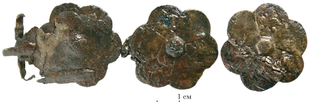
Рис. 7. Поясний набір

Найбільша кількість знахідок отримана під час розбору заповнення господарських ям, насамперед ями 5, у якій було зафіксовано понад 1000 артефактів, серед яких переважала кераміка османського часу. Поміж інших речей, особливий інтерес мала унікальна знахідка фрагмента поясного набору на ділянці основної території колишньої фортеці під будівельними руїнами Синагоги на глибині 0,8 м. Комплект складався з чотирьох деталей: рамкової пряжки з язичком розміром 3,8 × 3,4 см та трьох бляшок. Кожна бляшка (розміром 4,3 × 4,0 см) виконана у вигляді шестипелюсткової розетки із шестигранним виступом (розміром 0,9 см) у центрі та петелькою, розміром 1,4 × 1,3 см на внутрішньому боці. На пелюстках кожної бляшки було зображення трилисника, розташоване з чергуванням через одну пелюстку. Поясні бляшки зроблені з бронзи та планкіровані сріблом. На одній з бляшок збереглися залишки шкіри, до якої вони були прикріплені. Аналогії такому поясному набору простежуються ще у давньоуйгурському мистецтві, у зображенні представників вищого кола суспільства (Diyarbakirli 1993, p. 55), мистецтві сельджуків, зокрема із зображень на кахлі палацу у