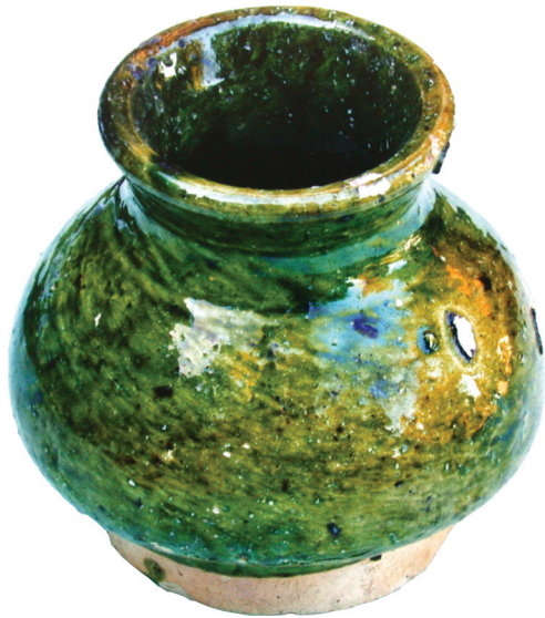
Рис. 5. Горщик з поливою з розкопу біля сирцевої стіни

вивчення території колишньої фортеці. Були закладені шурфи та траншеї у південній частині ділянки, які дозволили визначити спільні риси у будівельних конструкціях фортеці, встановлені у попередні роки.