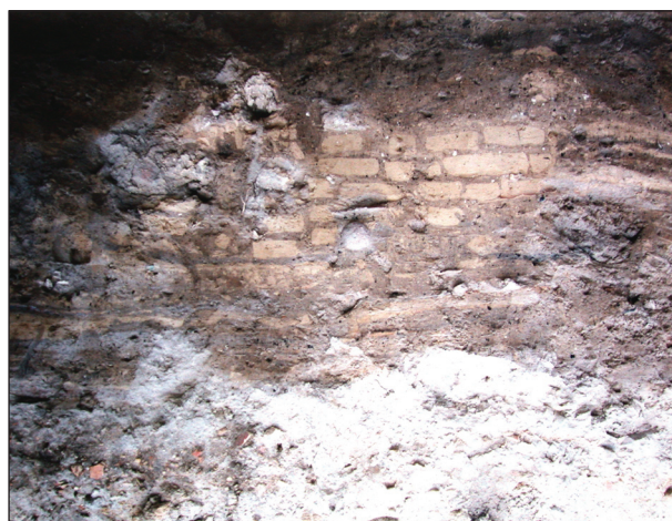
Рис. 2. Фрагмент стіни з сирцевої цегли

дищі (Брун 1879, с. 178). У відповідь на це литовці стали проти будівництва та « наряжоне на Дніпрі місто взяли » (Смирнов 1879, с. 340), і що ця фортеця була Очаків, яку було заснована « на яксь-то давніх руїнах » (Смирнов 1879, с. 341). Ідеться про відомий похід Богдана Глинського, провідника козацьких загонів та Черкаського намісника впродовж 1488—1495 рр., який двічі зруйнував новостворене містечко Менглі Гірея (у 1493 і 1494 рр.).