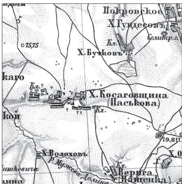
Рис. 2. Хутір Косоївщина (Паськова) на військово-топографічній мапі (Военно-топографическая карта Российской Империи 1846—1863 гг., созданная под руководством Ф. Ф. Шуберга и П. А. Тучкова. Масштаб: 3 версты на дюйм [1 : 126 000]. Ряд XXIII, лист 12)

О. С. Стрижак зазначив: «Ймовірно, цей гідронім знаходиться у зв'язку з Косоговим валом , що проходив за часів Запорізької Січі дець поблизу зіткнення Полтавищини, Слобожанщини і земель, належних до Запоріжжя» (Стрижак 1963, с. 27). Проте Д. І. Багалеї був іншої думки щодо походження назви Косоїв вал : «Валъ этотъ дѣйствительно можетъ быть названъ Косоговымъ, но имени боярина Косогова, который къ 1680 году и послѣдующихъ годахъ (а можетъ быть и нѣсколько раньше) занимался его постройкою. Лѣтописецъ Величико подѣ 1680-мъ годомъ передаетъ, что “по указу государскомъ генералъ и воевода Григорій Ивановичъ Косоговъ, почавши отъ городовъ Слободскихъ ажъ до Днѣпра по надѣ Берестовую, мѣрилъ поле на версты, волочачи колоду”. Результатомъ его измѣреній былъ чертежъ этого края; “новая черта” должна была служить продолженіемъ стараго (Перекопскаго) вала. Въ составъ ея входили: Цареборисовка, Савинскъ, Балаклѣя, Лиманъ, Бишкинь, Зміевъ, Соколовъ, Водолаги, Валки, Новый Перекопъ, Ольшаное, Золочевъ. Напечатанныя мною “Описныя и мѣрныя книги новой черты” свидѣльствуютъ о томъ, что ген. Косоговъ чрезвычайно внимательно изучилъ эту мѣстность и ея стратегическое значеніе...» (Гюльденштедт 1892, прим. 24).