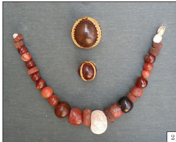
Рис. 4. Комплекс речей із с. Солонці: 1 — браслети, перстень та сережка; 2 — намисто