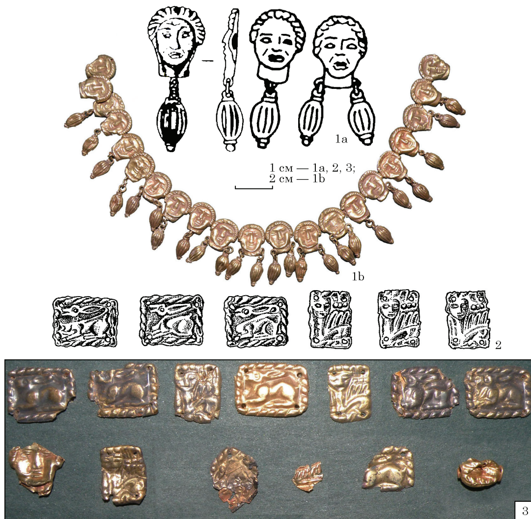
Рис. 1. Прикраси з курганів у с. Зелене (за Фіалко 2010): 1 — намисто із золотих фігурних бляшок; 2, 3 — рельєфні бляшки із фігурним зображенням