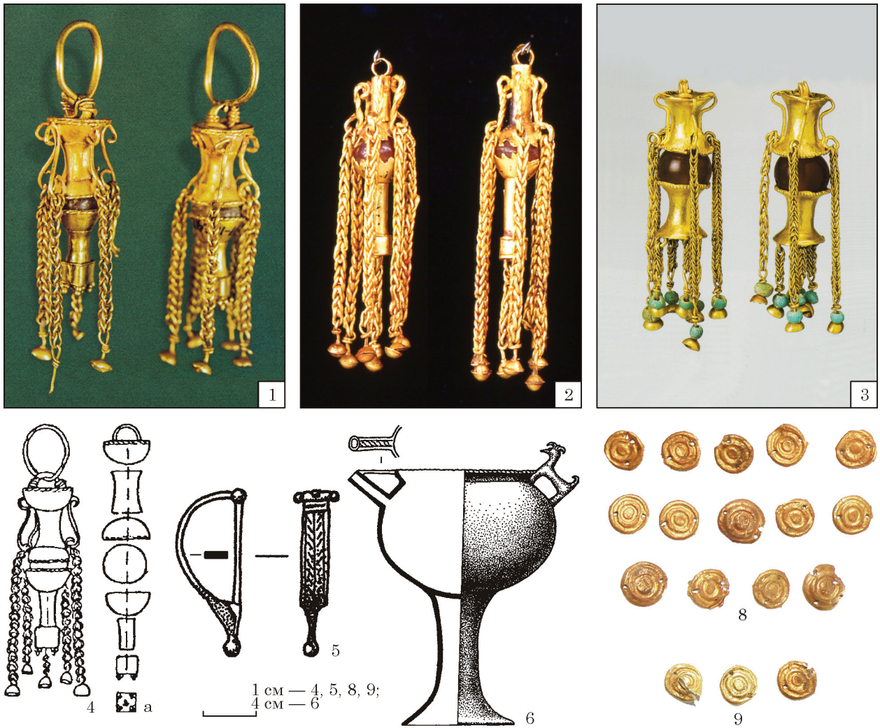
Рис. 5. Речі з комплексів Давидів Брід та Червоний Маяк: 1, 4—6 — Давидів Брід; 2 — Запруддя; 3 — Сладковський могильник (за Сокровища 2008); 7 — Червоний Маяк, поховання 128; 8 — золоті бляшки з правої руки; 9 — золоті бляшки з лівої руки