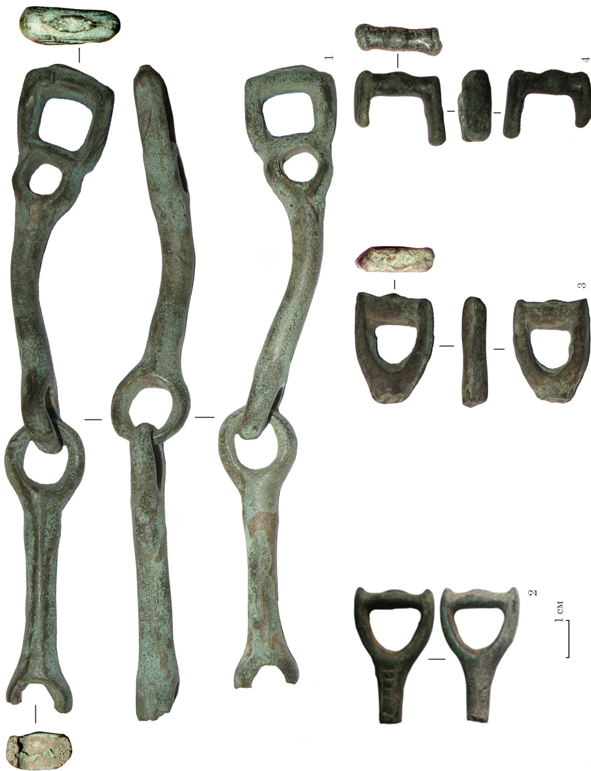
Рис. 2. Бронзові вудила з півночі Правобережного Степу: 1 — Дарниця; 2 — Василеве 2; 3 — Бобринецький музей; 4 — Борисівка Fig. 2. Bronze bits from the Northern Right Bank Steppes region: 1 — Darnytsia; 2 — Vasyliv 2; 3 — Bobrynets Museum; 4 — Borysivka