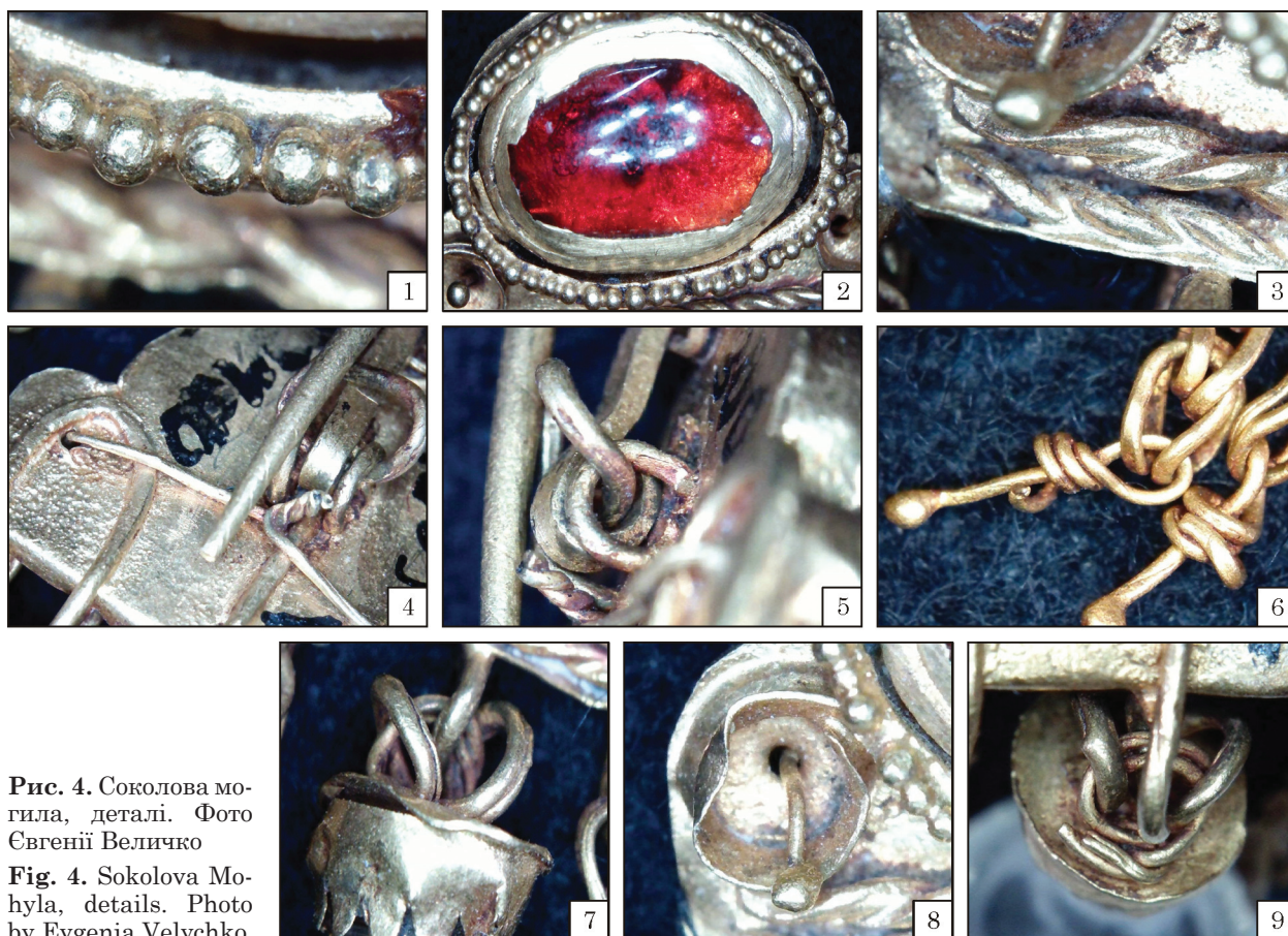
Рис. 4. Соколова могила, деталі.