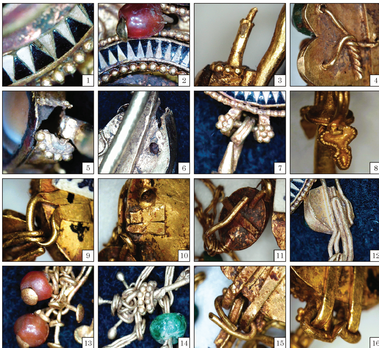
Рис. 2. Ногайчинський курган, деталі. Fig. 2. Nohaychik Barrow, details.