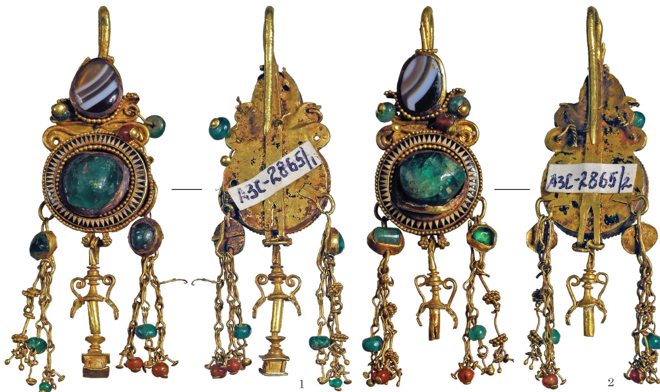
Рис. 1. Ногайчинський курган. Fig. 1. Nohaychik Barrow.

го р-ну, АР Крим). Розкопки А. О. Щепинського, 1974 р. (Щепинський 1977; Ščepinskij 1994; Симоненко 1993; Зайцев, Мордвинцева 2003).