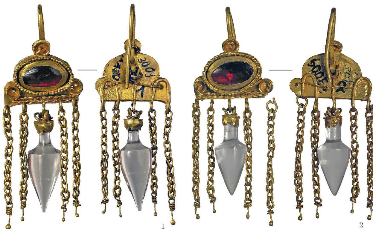
Рис. 3. Соколова могила. Fig. 3. Sokolova Mohyla.

оточений кільцевим гніздом П-подібного перетину, заповненим зерню. Вище та нижче центральної вставки трикутником розміщено три невеликі круглі касти з отворами, в яких, імовірно, були зафіксовані вставки-намистини. Зі звороту отвори з'єднані дротинкою, на кінцях якої кульки. Нижній край щитка прикрашено золотою філігранною косичкою.