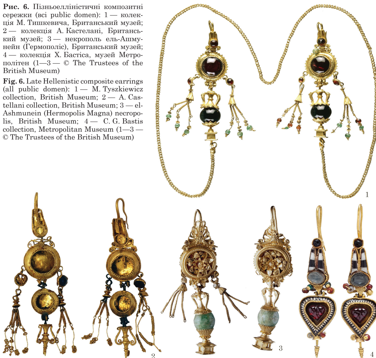
Fig. 6. Late Hellenistic composite earrings (all public domen): 1 — M. Tyszkiewicz collection, British Museum; 2 — A. Castellani collection, British Museum; 3 — el-Ashmunein (Hermopolis Magna) necropolis, British Museum; 4 — C. G. Bastis collection, Metropolitan Museum (1—3 — © The Trustees of the British Museum)

пробитий із середини назовні без ушкодження лицьового боку, може свідчити про спробу ремонту або відновлення (див. рис. 2: 5, 6). Одна з підвісок-ланцюжків на цій сережці також зазнала ремонту: кріплення та оригінальна петля на касти-основі однієї з підвісок втрачено, замість них з дроту достатньо недбало скручені нові, а на задній стінці касти пробито отвори для їх фіксації; сам касти-основа, судячи з залишків оригінального кріплення зі зворотного боку, перевернутий (рис. 2: 10, 11). Також втрачено значну частину намистин, які прикрашали підвіски-ланцюжки на обох сережках. Збережені кілечка з зерню, ймовірно, обрамляли намистини — така декоративна композиція була характерною для багатьох видів сережок із зоо- або антропоморфними скульптурними голівками періоду пізнього еллінізму (Pfrommer 1990, S. 143—181; Hackens, Lévy 1965, p. 548, fig. 11, pl. 21: a, b).